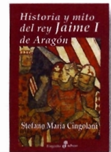
HISTORIA Y MITO DEL REY JAIME I DE ARAGÓN