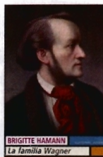
LA FAMILIA WAGNER Brigitte Hamann

El particular universo familiar que formaban los Wagner visto a través de cuatro de sus generaciones, en las que se mezclan el genio, la megalomanía, el arte y la política.