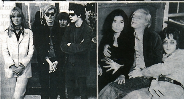
Warhol e invitados ilustres en la Factory.